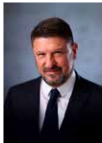
Nikos Hardalias Governor - Region of Attica

I am confident that through A + R Expo 2024 we will meet innovative proposals that provide solutions to real problems, in order to shape the field for collaborations and actions that contribute to our effort for a Digital Region with citizens first.