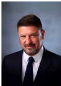
Νίκος Χαρδαλιάς Περιφερειάρχης Αττικής

Η νέα ψηφιακή εποχή είναι δυναμικά παρούσα σε κάθε πτυχή της ιδιωτικής και της δημόσιας ζωής μας. Και η Έκθεση A+R Expo 2024, είναι μια κορυφαία διοργάνωση στον τομέα αυτό, που έρχεται να μας εξοικειώσει με τις νέες τεχνολογίες, αλλά και να αναδείξει τη συνεχή προσπάθεια και τη δέσμευσή μας προς τον ψηφιακό μετασχηματισμό.