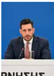
Κωνσταντίνος Κυρανάκης Υφυπουργός Ψηφιακής Διακυβέρνησης