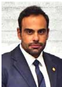
Ιωάννης Δάγκλης Πρόεδρος World UAV Federation - GREECE

Θα ήθελα να απευθύνω το θερμότερο καλωσόρισμά μου σε όλους τους προσκεκλημένους, συνέδρους και εκθέτες της 1ης A & R EXPO 2024, του μεγαλύτερου τεχνολογικού γεγονότος της Ελλάδας για τον Αυτοματισμό, τη Ρομποτική, τα Drones και την Τεχνητή Νοημοσύνη. Είμαι πολύ χαρούμενος που σημειώνω ότι αυτή η έκθεση πρόκειται να φέρει νέες ιδέες μαζί με την καινοτομία και τη δημιουργικότητα, πυροδοτώντας ταυτόχρονα το πνεύμα υψηλής τεχνολογίας στην Ελλάδα και τις γειτονικές χώρες. Η A & R EXPO 2024 θα διευκολύνει τη στενότερη αλληλεπίδραση και την πρακτική εμπειρία των εκθεμάτων που εκτίθενται. Καθώς προχωράμε, η Ελλάδα είναι μια ευρωπαϊκή χώρα που έχει ήδη δώσει προτεραιότητα σε τέτοιες λαμπρές πρωτοβουλίες, αντιμετωπίζοντας τις προκλήσεις της νέας εποχής του ψηφιακού μετασχηματισμού που είναι εμφανείς στην καθημερινή ζωή. Τέτοιες εκδηλώσεις παρουσιάζουν νέα προϊόντα και εκπληκτικές επιχειρηματικές ευκαιρίες για την τοπική αγορά φέρνοντας κατασκευαστές, επαγγελματίες και χρήστες μαζί στον ίδιο χώρο.